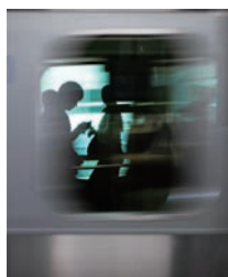
キャンノンフォトクラブ東京ZERO 第15回 写真展 ゆらぎ

6月4日(木)～6月10日(水) 太鼓奏者・林英哲を追った写真展。国内外の公演に同行し、舞台とその軌跡、太鼓に向き合う姿を記録した作品群を、演奏活動55周年記念として展示します。