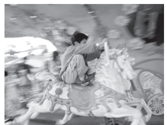
亀井 正樹 写真展 向こうの丘のパラダイス ー想い出の向ヶ丘遊園地 '90s～2002ー

6月18日(木)～6月24日(水) さまざまな時間や場所の海を撮り続けることで見出した自身の「藍色」。日本の伝統美である藍を和紙で表現することで「侘び寂び」を静かに伝える展示です。