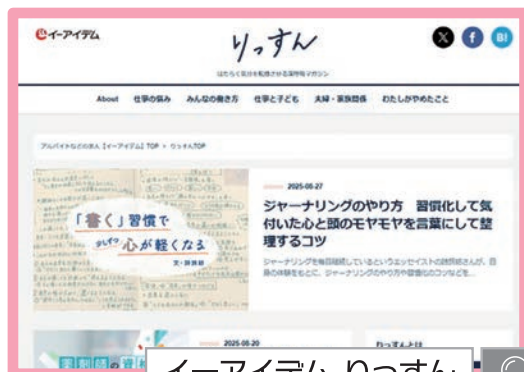
イーアイデム りっすん

明日からの「はたらく気分」をちょっと転換させていく、 女性向けのワークスタイルメディアです。